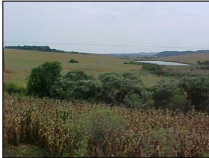
sub-unidade morfoescultural 2.4.4

A sub-unidade morfoescultural número 2.4.5, denominada Planalto do Alto/Médio Piquiri, situada no Terceiro Planalto Paranaense, apresenta dissecação média e ocupa uma área de 2.160,60 km², que corresponde a 15,42% desta Folha. A classe de declividade predominante está entre 6-12% em uma área total de 2.545,04 km². Em relação ao relevo, apresenta um gradiente de 420 metros com altitudes variando entre 600 (mínima) e 1.020 (máxima) m. s. n. m. As formas predominantes são topos alongados e isolados, vertentes convexas e convexo-côncavas e vales em “U” aberto. A direção geral da morfologia é NW/SE, modelada em rochas da Formação Serra Geral.