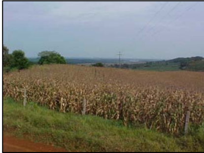
sub-unidade morfoescultural 2.4.4

A sub-unidade morfoescultural número 2.4.4, denominada Planalto de Palmas/Guarapuava, situada no Terceiro Planalto Paranaense, apresenta dissecação baixa e ocupa uma área de 3.373,71 km², que corresponde a 20,45% desta Folha. A classe de declividade predominante é menor que 6% em uma área de 2.008,26 km². Em relação ao relevo, apresenta um gradiente de 660 metros com altitudes variando entre 700 (mínima) e 1.360 (máxima) m. s. n. m. As formas predominantes são topos aplainados, vertentes retilíneas e convexas e vales em “U”, modeladas em rochas da Formação Serra Geral.