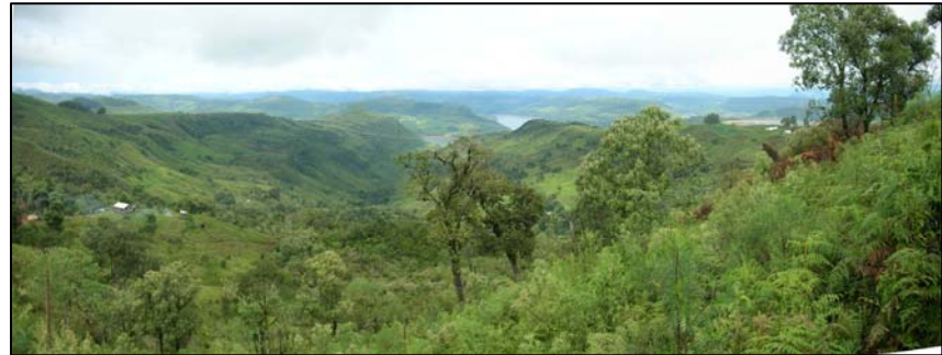
sub-unidade morfoescultural 2.4.2

A sub-unidade morfoescultural número 2.4.2, denominada Planalto do Foz do Areia/Ribeirão Claro, situada no Terceiro Planalto Paranaense, apresenta dissecação alta e ocupa uma área de 2.411,20 km², que corresponde a 14,61% desta Folha. A classe de declividade predominante está entre 12-30% em uma área de 1.007,65 km². Em relação ao relevo, apresenta um gradiente de 720 metros com altitudes variando entre 620 (mínima) e 1.340 (máxima) m. s. n. m. As formas predominantes são topos alongados, vertentes retilíneas e côncavas e vales em degraus. A direção geral da morfologia é NW/SE, modelada em rochas da Formação Serra Geral.