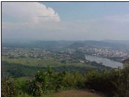
sub-unidade morfoescultural 3.5.2

A sub-unidade morfoescultural número 3.5.2, denominada Planícies Fluviais, da unidade morfoestrutural Bacias Sedimentares Cenozóicas e Depressões Tectônicas, apresenta sedimentos inconsolidados do Período Quaternário.